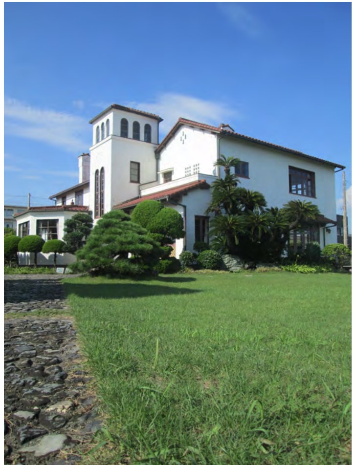
▲国登録有形文化財。中央の展望室からは、美しい富士山と海を眺める事ができます。

昭和47年に夫人が帰国した際に屋敷の敷地の半分が静岡市に寄贈され、残り半分と建物は静岡市が買い取りました。現在は一般に公開されています。