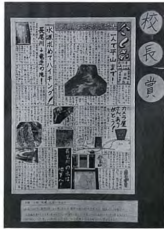
西奈中2年生が探訪したことを新聞にして掲示

木簡は帳簿や荷札として使われた。発見された木簡は人集めの時の記録簿だったらしい。平成8年(1996年)1月1日発行「広報しずおか(静岡市役所広報課)」より