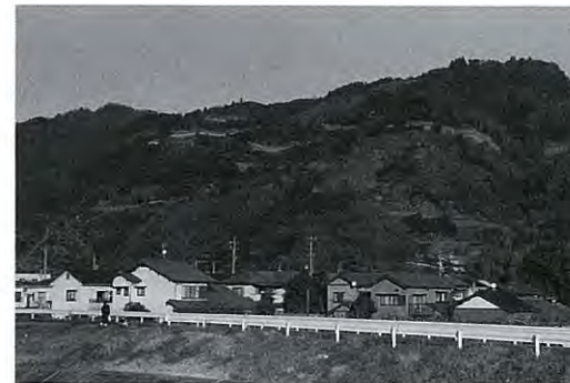
梶原景時親子にちなんだ伝説のある梶原山