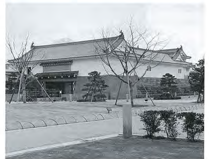
駿府城薪能の会場予定地東御門前広場

「薪能」公演の時期は、今年の5月31日（土）を予定しています。会場は、駿府公園内の東御門前広場で、そこに特設の能舞台と1,200人規模の客席を設けます。ライトアップされた東御門・巽櫓を舞台背景に取り込み、篝火の中で繰り広げられる薪能は、きっと皆さんの心を幽玄の世界へ誘ってくれることでしょう。万一、公演当日が雨天の場合は、隣接する市文化会館中ホールで行います。チケットの料金や販売方法など詳細については、追って広報しずおか、新聞等で発表しますので、よろしくお願ひします。