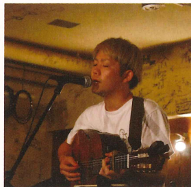
スギタヒロキ (シンガーソングライター)