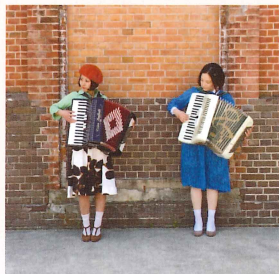
fennel (アコーディオンデュオ)