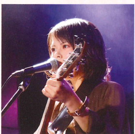
Ritomo (シンガーソングライター)